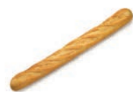
54650 Maxi Baguette 36UDS/CAJA • 250G/UD