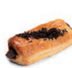
59311 Napolitana de Chocolate Fácil 50UDS/CAJA • 100G/UD