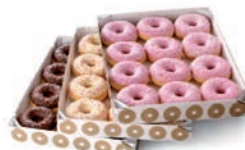
61640 Dots Mix Box 36UDS/CAJA • 52G/UD