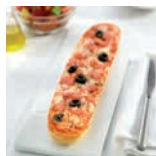
65560 Baguette-pizza de York 30UDS/CAJA • 140G/UD