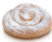
59362 Ensamada Fácil 32UDS/CAJA • 100G/UD