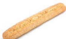
52091 Bastón 20UDS/CAJA • 395G/UD