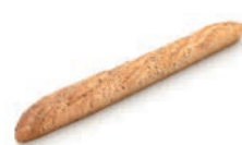
52900 Baguette de Cereales Gran Reserva 26UDS/CAJA • 275G/UD