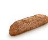
57862 Kornspitz 30UDS/CAJA • 240G/UD