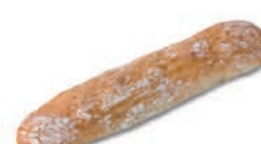
61050 Torta Artesana 15UDS/CAJA • 500G/UD