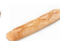
56360 Barra Rombos 23UDS/CAJA • 285G/UD