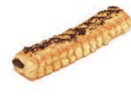
55260 Herradura Plus de Choco 50UDS/CAJA • 175G/UD