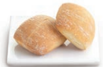
Mini Pincho • 52401